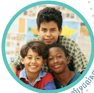
គាំទ្រដល់មាតាបិតារបស់យើង!